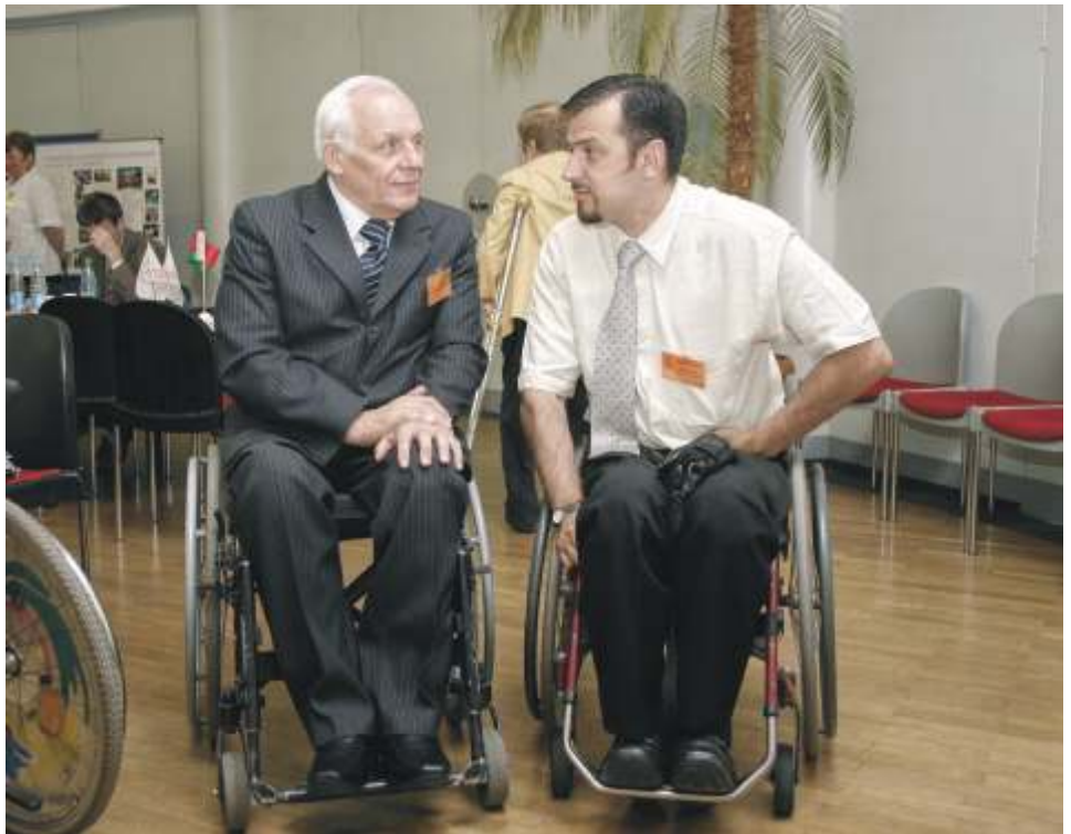
Международная научно-практическая конференция «Инвалиды и общество», Минск, июль 2008 года

Кроме того, в рамках проекта будут проведены мероприятия, направленные на повышение осведомленности общественности о положении инвалидов и понимания их прав, потребностей и потенциала, а также общенациональный конкурс на лучшего наместителя для инвалидов и лучшую государственную структуру по предоставлению услуг инвалидам.