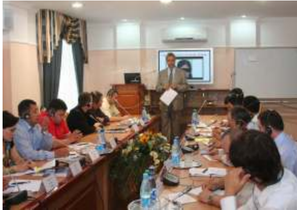
Семинар по противодействию торговле людьми

Международная организация по миграции (МОМ) стала одной из основных международных организаций-партнеров, оказывающих поддержку Правительству Республики Беларусь в реализации мер по борьбе с торговлей людьми. С сентября 2002 года МОМ осуществляет программу по борьбе с торговлей людьми при поддержке Шведского управления международного развития и сотрудничества (Sida), Агентства США по международ-