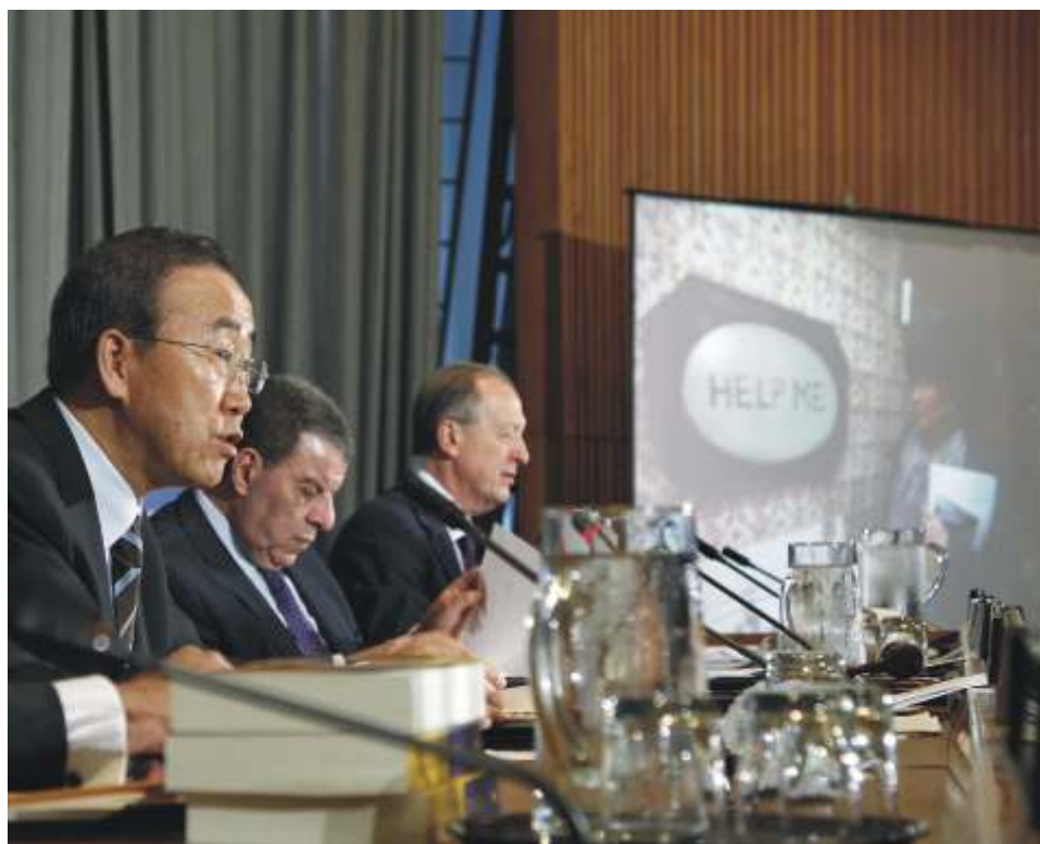
Интерактивный тематический диалог «Коллективные меры для искоренения торговли людьми»

Проблема торговли людьми всегда была одним из приоритетных направлений деятельности ООН, но, по мнению экспертов, активизация усилий берет отсчет с рубежа 1980-х годов. В 1975 году состоялась первая сессия Рабочей группы по проблемам рабства (потом ее переименовали в Рабочую группу по современным формам рабства). Основной ее