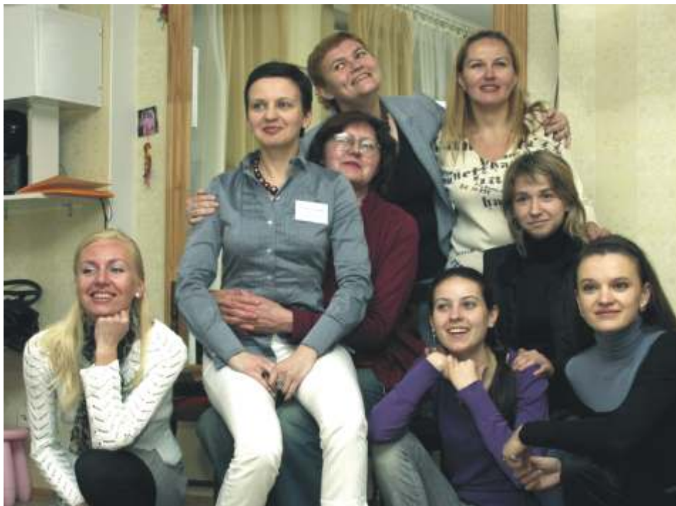
Ролевая игра «Создай семью». Журналисты и представители ЮНФПА, май 2009 года