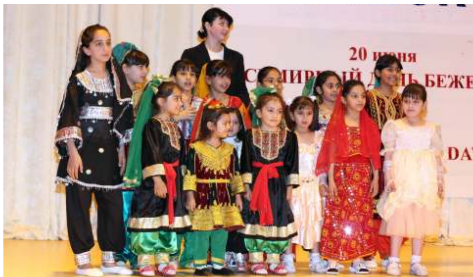
Участники детского гала-концерта, посвященного Всемирному дню беженцев, 18 июня 2009 г.

В 2001 году Беларусь присоединилась к Конвенции о правах беженцев 1951 года и Протоколу к ней 1967 года, и с того времени добилась значительного прогресса в разработке и усовершенствовании необходимого законодательной базы и административных процедур, регулирующих предоставление убежища, статуса беженца и гуманитарной помощи беженцам в соответствии с между-